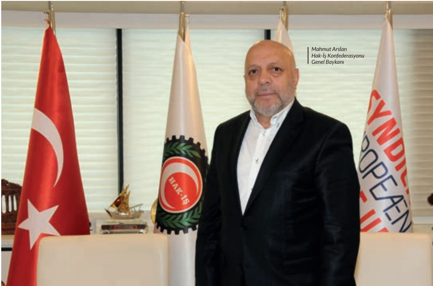
Mahmut Arslan Hak-İş Konfederasyonu Genel Başkanı