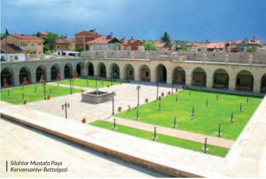
| Silahatir Mustafa Paşa Kervansarayi-Battalgazi