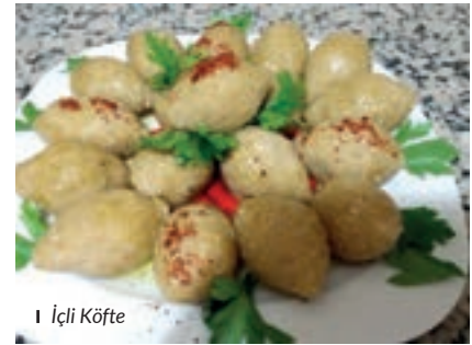
I İçli Köfte

iyice sararıp pişince üzerine salça, karabiber, tuz, kimyon ilave edilip 1 dakika pişirilir. Ocağın altı kapatılır ve iç malzeme soğuyup donmaya bırakılır. Köftelik bulgur geniş bir kaba alınır üzerine 1 su bardağı sıcak su konur 1- 2 dakika sonra sırayla irmik, kıyma, un, yumurta ve salça eklenir. İyice yoğrulur. Yoğrulmuş malzemeden cevizden biraz daha büyük parçalar alınır. Parçalar yuvarlanır. Her parçanın ortası başparmak içe gelecek şekilde parmak yardımıyla ince