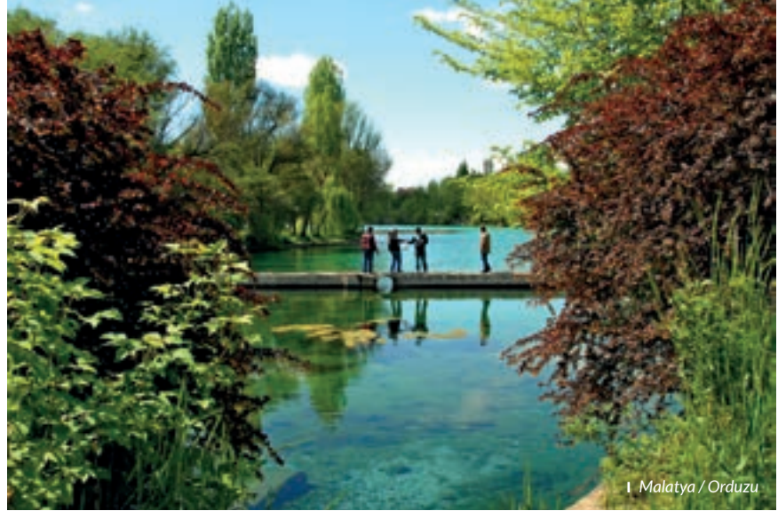
I Malatya / Orduzu

KAĞIT KEBABI: Bir tava içinde kuş başı doğranmış eti kendi yağında soteleyin. Daha sonra soğan, mantar ve biber ilave ederek sotelemeye devam edin. Tuz, karabiber ve kekik ekleyin. Bezelye koyup ateşten alın. İyice yağlanmış kağıdı ikiye katlayın. Bu malzemeyi içine koyup iki ucunu yukarı doğru yapıştırıp katlayın. Yan uçlardan kıvırdıktan sonra önceden ısıtılmış 250 derecedeki fırında 20 dakika pişirip sıcak olarak servise sunun. Pişirilmesi yaklaşık 16 saat süren bu yemek sadece belirli lokantalarda yapılmaktadır.