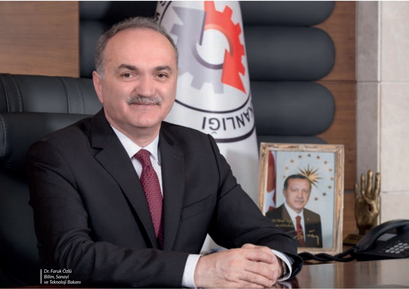
Dr. Faruk Özlü Bilim, Sanayi ve Teknoloji Bakanı

Teknolojinin hayatımıza daha fazla nüfuz etmesi ile birlikte günlük yaşamımızdan iş dünyasına pek çok alanda büyük deėişimler yaşanmaktadır. Bu deėişimler ve etkileri de teknolojideki gelişmelerle paralel olarak artarak devam edecektir. Artık teknoloji hem günlük yaşam, hem de iş yapma biçiminin merkezindedir. Bireyler, işletmeler, kurumlar günlük hayatımızda etkisini artıran teknolojiyi “nasıl daha verimli, kaliteli ve hızlı olabilirim” yaklaşımıyla benimsemektedirler.