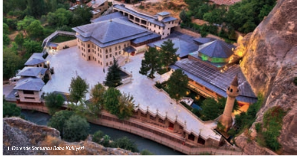
I Darende Somuncu Baba Külliyesi

İlimizde 2 Organize Sanayi Bölgesi faaliyettedir. I. Organize Sanayi Bölgesi; 300 hektar arazi üzerine kurulmuş olup, halen 138 fabrika üretimini sürdürmektedir. II. Organize Sanayi Bölgesi ise; 350 hektar arsa üzerine kurulmuş olup, bu güne kadar 131 işletme yatırımını tamamlayarak üretimini sürdürmektedir. 21 tesisin inşaat çalışmaları devam etmektedir. I. ve II. OSB'de yer kalmaması ve müteşebbislerin artan yatırım yeri talebini karşılamak üzere, tespit edilen 1200 hektarlık alan I. OSB'ye eklenmiştir. Mevcut iki OSB alanından daha büyük olan bu alanın sanayiye kazandırılmasıyla, Malatya'nın 20-30 yıllık sanayi parsel ihtiyacı karşılanmış olmaktadır. OSB'lerde faaliyet gösteren