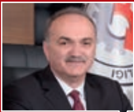
Bilim, Sanayi ve Teknoloji Bakanı Dr. Faruk ÖZLÜ:

KAYISI'NIN BAŞKENTİ, CAZİBE MERKEZİ; MALATYA