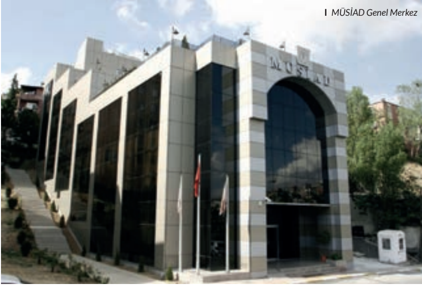
I MÜSİAD Genel Merkez