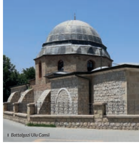
| Battalgazi Ulu Camii

> hac ve umre ziyaretleri için Suudi Arabistan) uçak seferler yapılmaktadır. İlin Büyükşehir statüsüne kavuşması ile de yatırım düzeyini daha da üst seviyelere çıkaracak çalışmalar yürütülmektedir.