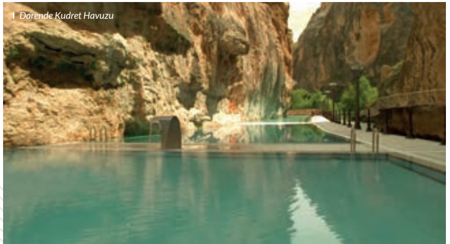
| Darende Kudret Havuzu

MALATYA KÖMBESİ: Kömbenin bir adı da "hıtap"tır. İki kat hamur arasında yapılan kömbenin hamuru, hafif maya ve yağ katılarak yoğrulur. Daha sonra kömbenin içi hazırlanır. Kömbe içi cevizli, patatesli veya kavurma etli olabilir. Hazırlanmış olan hamur, yağlanmış temiz bir sacın içine serilir. Üzerine tereyağında kavrulmuş et konulur. Bunun da üzerine bir kat daha hamur serilir. Üzerine hafifçe yoğurt sürülür, ağzına bir sac kapatılır. Bunlar yapıldıktan sonra sacın altına meşe közü, üstüne tezek közü yığılır. Ayrıca üzerinde de tezek yakılır. Kızardıktan sonra sactan çıkartılır, dilimlenerek servis yapılır.