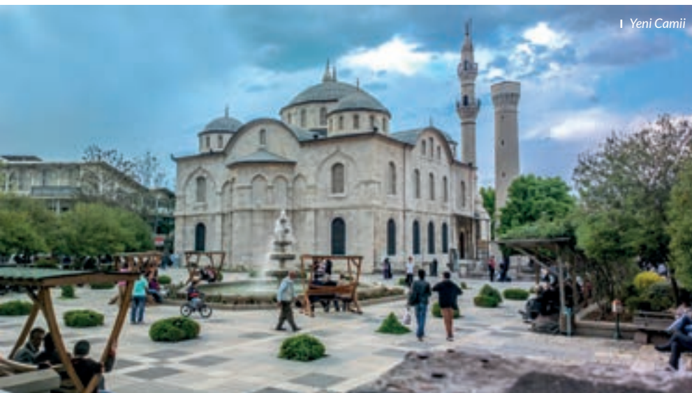
I Yeni Camii

Malatya standartları geliştirilmiş karayolu, havayolu ve demiryolu ulaşım imkânlarına sahiptir. Doğu batıya, kuzeyi güneye bağlayan stratejik konum ile ulaşım, lojistik ve ticaret alanında avantaj sağlamaktadır. Malatya Havaalanından yurtiçi (Ankara, İstanbul, İzmir, Antalya) ve yurtdışına (Almanya ve