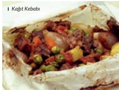
I Kağıt Kebabı

BEYRAN: Koyun etine üzeri dört parmak geçecek şekilde su ilave edilerek ocağa alınır. Su kaynamaya başladığında 20-25 dakika başında bekleyerek kemiklerden ve etten çıkan kirli köpükler (kef) kevgir yardımıyla alınır. (Suyunun berrak ve daha temiz olması için), farklı bir tencerede çok ince çekilmiş kuyruk yağı ve sana margarin kıkırdak oluncaya kadar kavrulur, tel süzgeçten geçirilerek pişmekte olan etin üzerine süzdürülüp, ağzı kapatılır. 1-1.5 saat kısık ateşte etlerin pişmesi beklenir. Aynı bir tencerede kaynayan 3 bardak suyun içine 1 su bardağı pirinç aktarılarak pirinçler, tane tane lapa olmadan pişirilir.