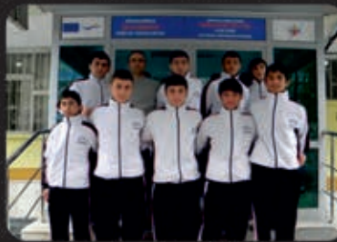
Şampiyon Güreş Takımımız