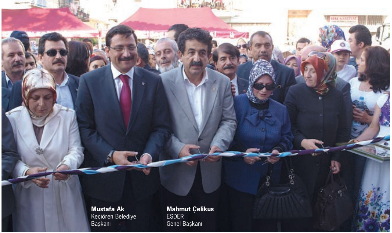
Mustafa Ak Keçiören Belediye Başkanı