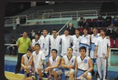
Şampiyon Basketbol Takımımız

Demetevler Mah. 360. Cad. (8. Cad.) No:19 Yenimahalle - ANKARA www.aziziyelisesi.com Tel:335 33 57