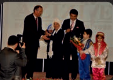
Yılın Kültür Ödülleri